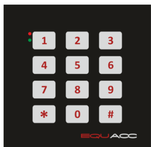
EQU-R143.C nadruk czarny