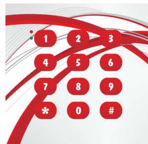
EQU-R143.X nadruk dowolny (przykładowy wzór)*