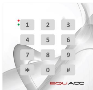
EQU-R143.J nadruk jasnoszary